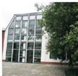
vchod do budovy „M“